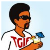
7 großartige Things To Do für ...