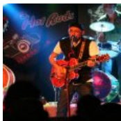
10 Top Ausgehspots in Kapstadt