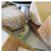
Samstags Wein- und ...

Mexiko Urlaub Erleben Sie Mexiko. Top Angebote: Termine bis Apr'13. Günstig buchen! www.Berge-Meer.de/Mexiko