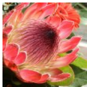
August Events in Kapstadt und im ...